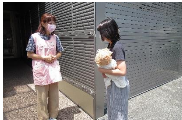
中部産婦人科正面玄関東側にあります。